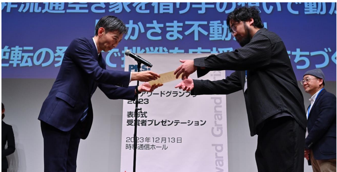
2023年PRアワードグランプリ表彰式の様子